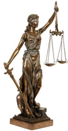
1. ábra: Iustitia.

Ezen nehéz kérdés megválaszolására többféle álláspont alakult ki. Az egyik azt állítja, hogy a jog igazságossága sohasem valósulhat meg, hiszen ami az egyik eszmény szerint igazságos, az a másik szerint nem biztos, hogy az. Ez az igazságosság szubjektív jellegéből adódik. Ezt alátámasztja az a tény, hogy az igazságosság meghatározása maga is koronként változik, a változó, éppen uralkodó világszemlélethez vagy az adott ország hivatalos történetiszemléletéhez, valamint a valláshoz vagy a politikai-jogi ideológiához kötődik. 14 Véleményem szerint ezt a kérdést egy egyszerű példával is alá lehet támasztani. Tegyük fel, hogy egy afrikai törzsnél hagyomány, évszázadok óta bevett szokás az áldozás az isteneknek.