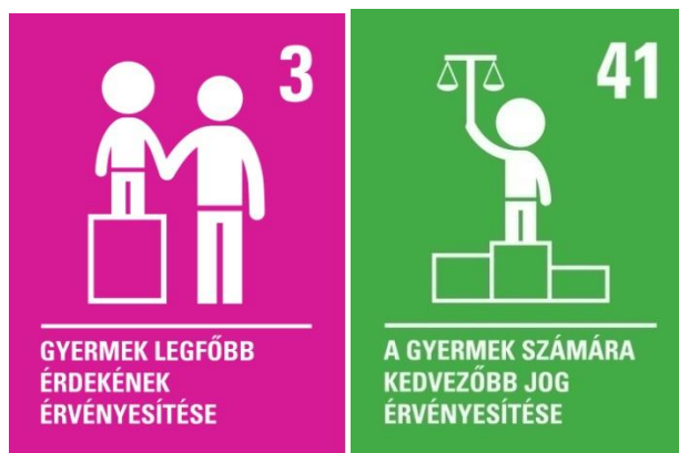
II/1. Kép: Legfőbb gyermekjogok a bírósági eljárásban 19

A gyermek polgári eljárásban való részvételének számos megnyilvánulási formája van, melyeknél a fentiekre tekintettel nagy körültekintéssel kell eljárnia a bíróságoknak. A gyermek meghallgatását szeretném a tanulmányomban megemlíteni, mivel a gyakorlatom alatt részt vettem ilyen eljárási cselekményen. A tizennegyedik életévét betöltött kiskorú, valamint ítélőképessége birtokában lévő tizennegyedik életévet még be nem töltött gyermek meghallgatást foganatosíthatja a bíróság, ha mérlegelés útján ennek szükségességét állapította meg. A kiskorút mindig tájékoztatni kell életkorának, érettségének megfelelő módon a meghallgatása előtt az igazmondási kötelezettségre és annak jogkövetkezményeire. 20 A Brüsszel II. B rendelet hatására került bevezetésre Magyarországon, hogy a bíróság köteles az ítélőképessége birtokában lévő gyermeket értesíteni a nyilatkozattétel lehetőségéről a szülői felügyelet gyakorlását érintő ügyekben. 21 A bíróság meghallgathatja a gyermeket közvetlenül vagy szakértő útján, ha indokoltnak tartja a szakember bevonását az eljárás körülményei alapján. A gyermek maga is kérheti tárgyaláson való meghallgatását, illetve a bíróság hivatalból is foganatosíthatja azt, ha indokoltnak tartja elrendelését. A tizennegyedik életévét betöltött gyermek szülői felügyeletére és harmadik