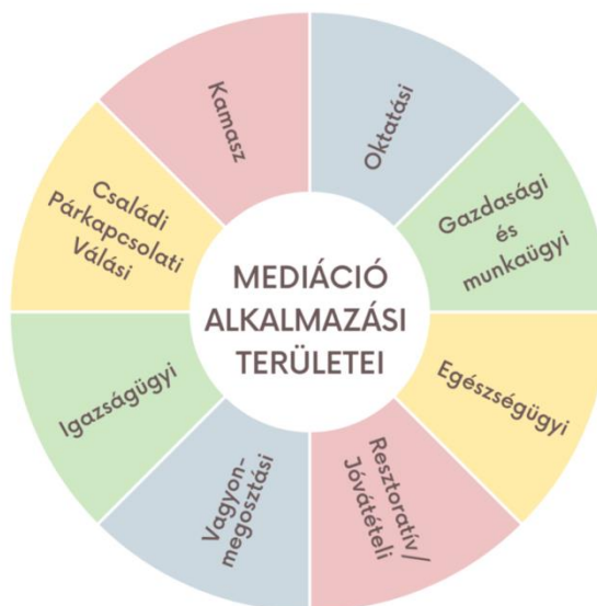
III/1. Kép: A mediáció alkalmazásának területei 30

kialakítva, mediációs helyiségből a Szegedi Járásbíróságon egy áll rendelkezésre. A gyermekek közvetítői eljárásba való hatékony bevonásához szükséges személyi feltételek vonatkozásában elmondható, hogy kevés olyan bíró van, aki rendelkezik a szükséges szakmai képzéssel és megfelelő pszichológiai ismerettel, gyakorlati tapasztalattal. A Szegedi Járásbíróságon a mediáló bírák számuk mindösszesen három főre tehető. 28 A gyermekbarát igazságszolgáltatás jövője lehet a közvetítői eljárásba történő bevonásuk a gyermek jogainak érvényesülése, a kiskorú véleményének megismerése és a gyermek legfőbb érdekének garantálása okán. 29