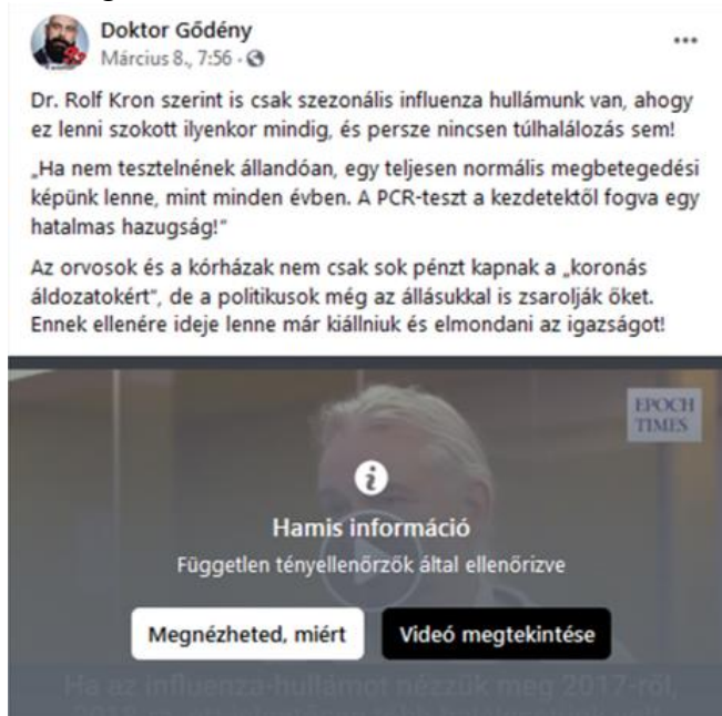
4. ábra Hamis információknak jelölt poszt

A tényellenőrzők feladata a hírfolyam minőségének javítása. A szabályozás azonban itt nem törléssel történik, mint a sértő tartalmak esetében, mivel az álhíreket a Facebook főszabály szerint nem távolítja el. Kivételt képeznek a közösségi alapelveket sértő bejegyzések vagy fiókok (pl. spam, hamis fiók stb.). 39 A Facebook vezetősége szerint a hamis hírek eltávolítása tehát a szólásszabadságot sértené, ugyanakkor úgy véli, hogy terjedésüket nem lehet tétlenül szemlélni. A platform ezért az álhírek „láthatóságát leveszi,” azaz közreműködik abban, hogy jóval kevesebb emberhez jussanak el a kétes és hamis bejegyzések. Ennek hatása tulajdonképpen majdnem megegyezik a törléssel vagy tiltással. Ha az álhírt terjesztő fiók nem személyes jellegű, hanem például egy híroldal, akkor a Facebook csökkenti a fiók bevételét azáltal, hogy elveszi tőle a hirdetési lehetőségeket. Elhomályosítja továbbá a bejegyzést és megjelenít egy figyelmeztető üzenetet, miszerint „az információ hamis” (4. ábra). Általában is, ha a felhasználók egy 90 napnál régebbi hírt osztanak meg, akkor figyelmezteti őket az eltelte időre, és ezt álhír esetén is megteszi. 40