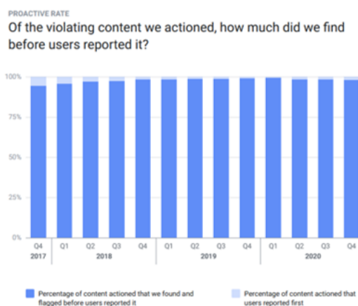
3. ábra A szexuális tartalom miatt kifogásolt tartalmak mesterséges intelligencia által kiszűrt (sötétkék) és felhasználók által jelentett (világoskék) aránya